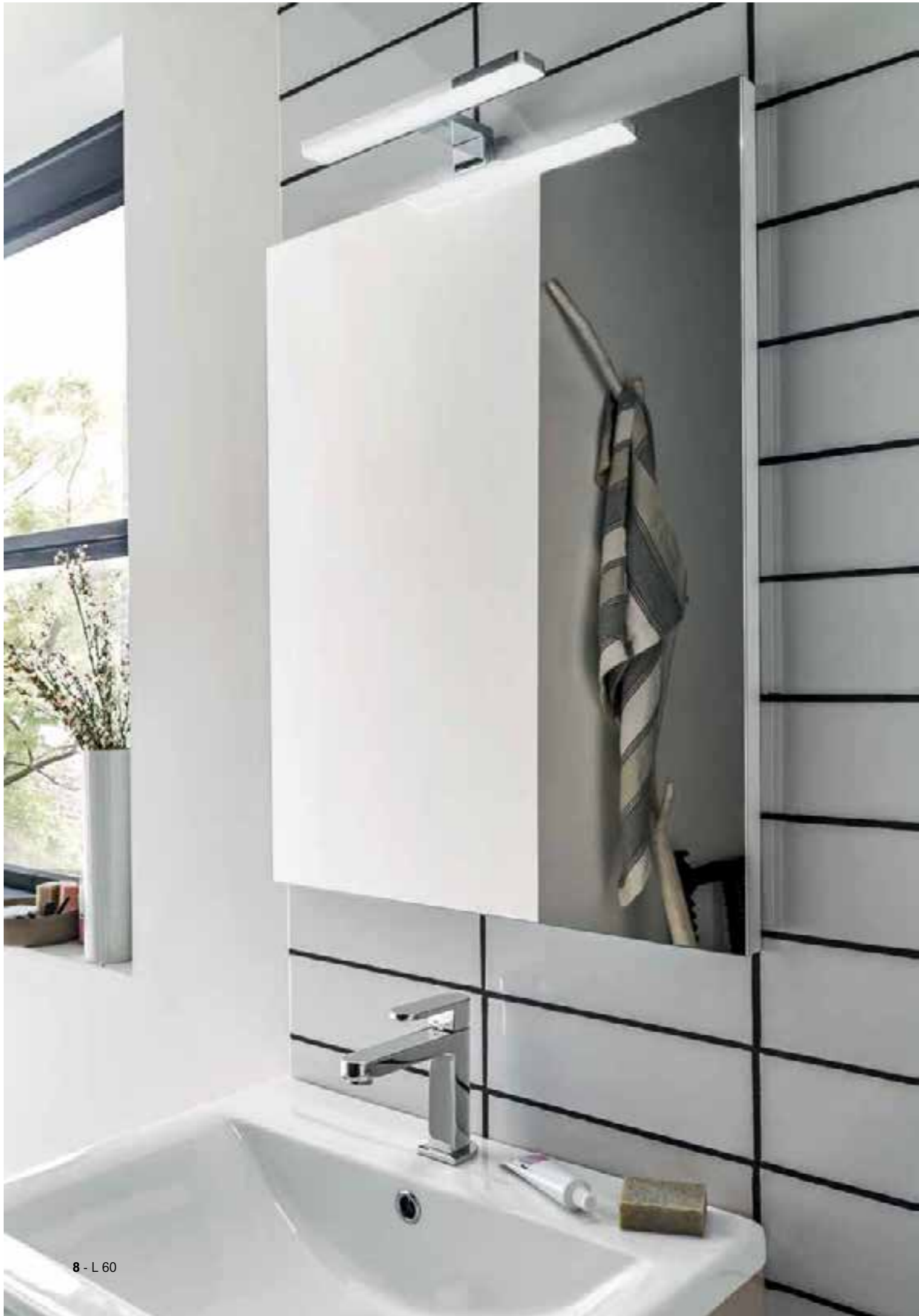
8 - L 60

CLEVER: LA PRATICITÀ DEL LAVABO IN CERAMICA