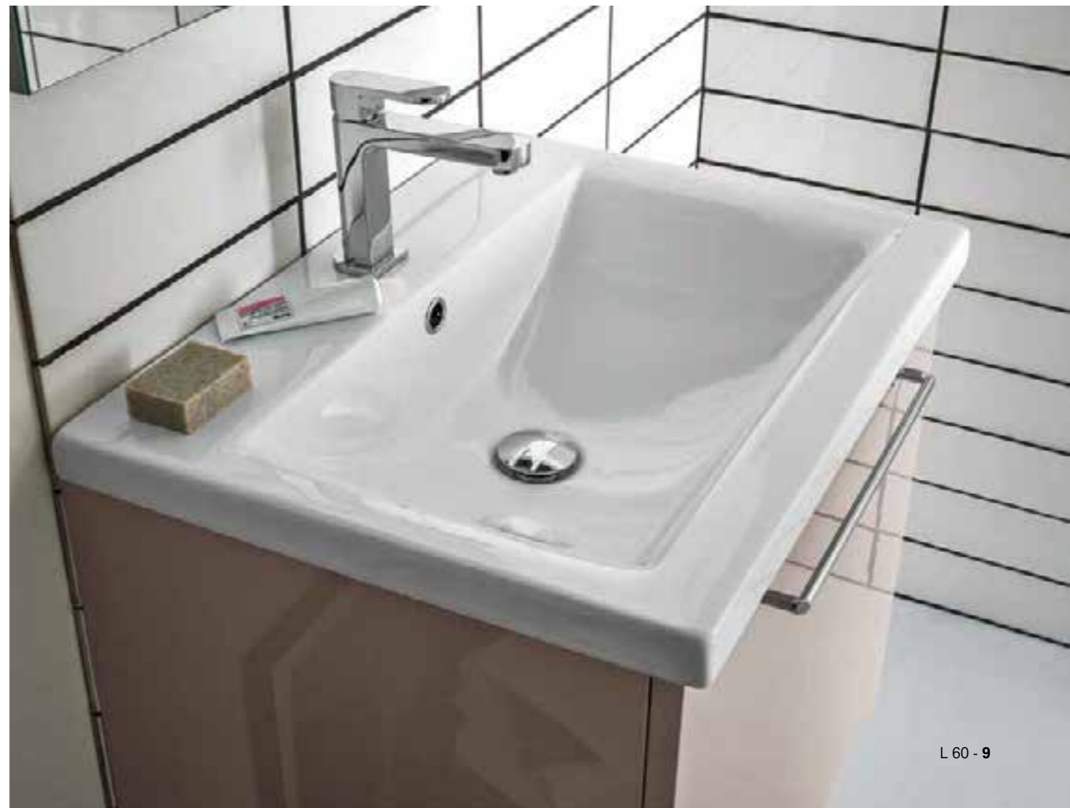
L 60 - 9